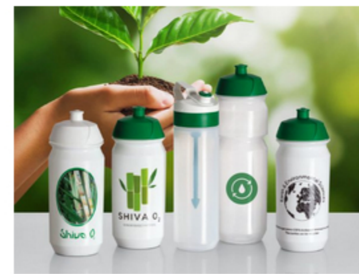
Trinkflaschen auch aus biologisch abbaubarem Kunststoff