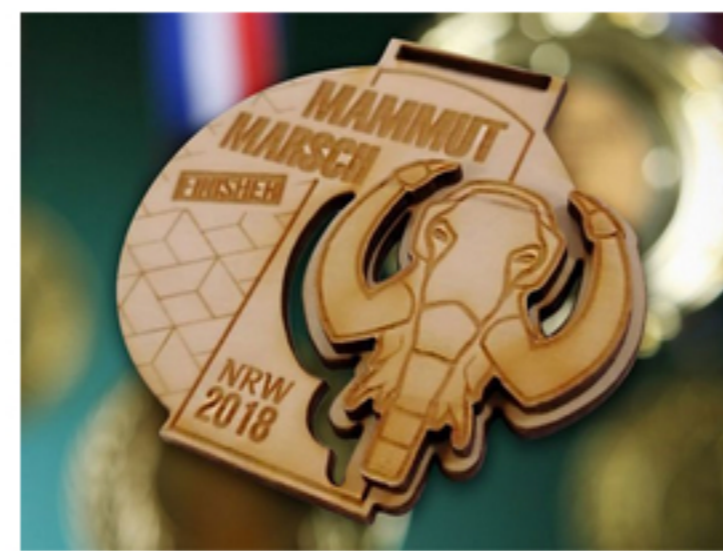
Individuelle Medaillen aus Holz oder Metall

Neben klassischen Medaillen und Pokalen aus Metall bieten wir auch innovative Modelle aus Holz an. Als Flaschen-Spezialist produzieren wir für unsere Kunden bedruckte Trinkflaschen in Spitzenqualität, verschiedenen Modellen, Größen und Materialien. Wir liefern Ihnen Starterbeutel in kleinen und großen Stückzahlen in vielen Ausführungen und Farben.