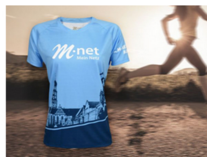
Funktions-Bestseller mit Druck im Damen-Schnitt