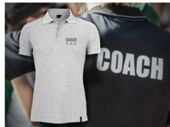
Polo-Shirt Klassiker aus Bio-Baumwolle