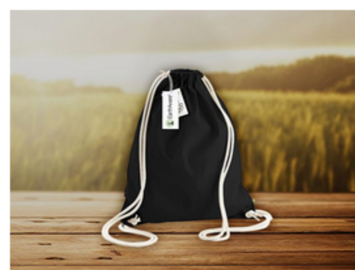
Gymbag alternativ auch aus Bio-Baumwolle