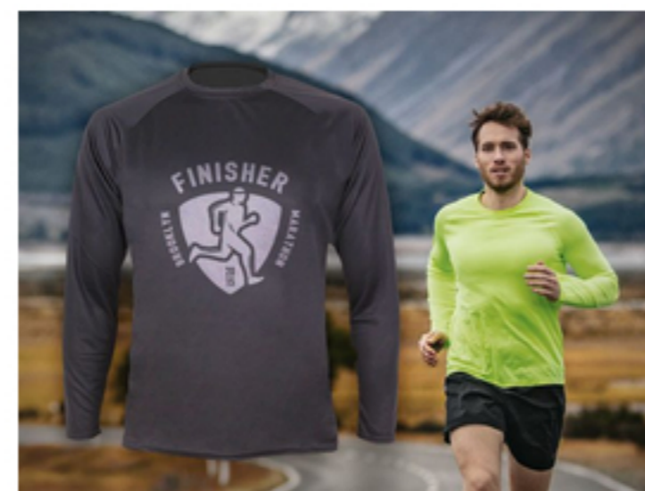
Funktionshirt-Klassiker als Langarm-Variante

Die beste Jahreszeit für Laufveranstaltungen und Messen steht vor der Tür. KONABLE bietet Ihnen Funktionshirts mit Kurz- oder Langarm, diese können mit photorealistischen Motiven vollsublimiert bedruckt werden. Baumwolltextilien, wie Shirts, Polos, Sweater bieten Ihnen ebenfalls viele individuelle Veredelungsmöglichkeiten.