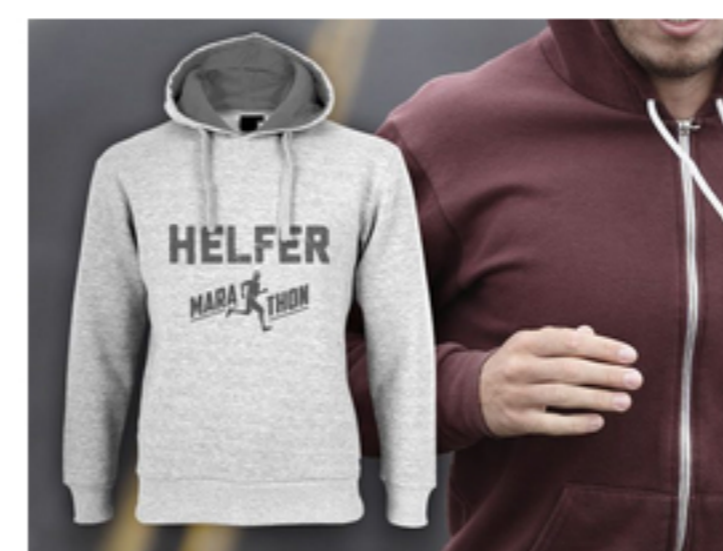
Hoodys für kühle Tage