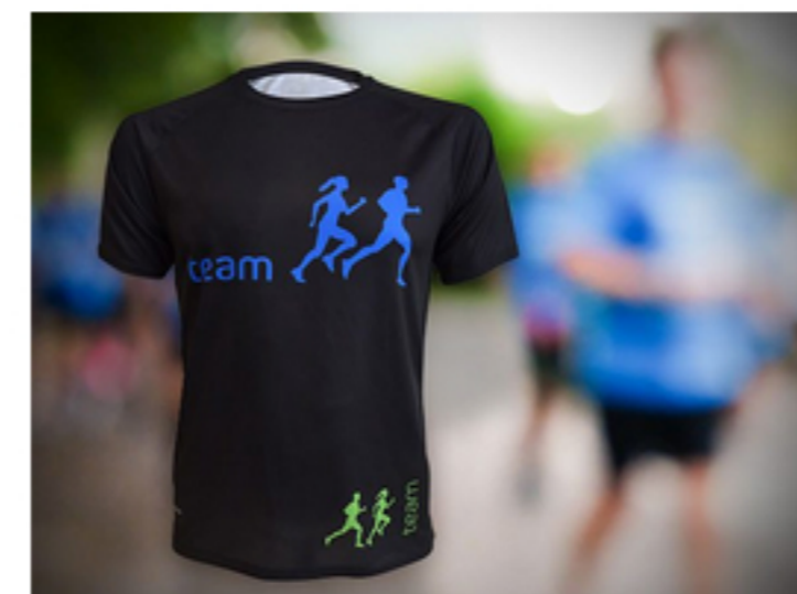
Viele Modelle aus recyceltem Polyester